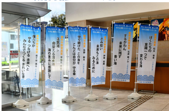
(入賞作品のほい旗)

主催 公益社団法人 清水清港会 後援 中部運輸局静岡運輸支局・中部地方整備局清水港湾事務所 海上保安庁清水海上保安部・名古屋検疫所清水検疫所支所 静岡県・静岡市・静岡市教育委員会