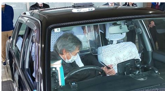
刃物を突き付けられた時の対応を実習

特徴等を聞き取り、その内容を配車担当が実際に110番通報し、日時・場所、被害状況、犯人の特徴、逃走方面の情報を伝えるというもの。