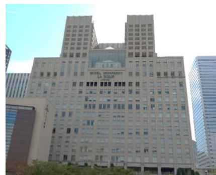
ホテルモントレ ラ・スール大阪