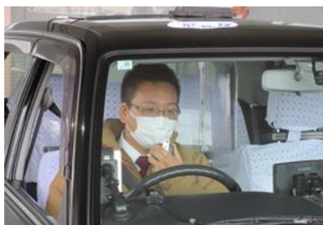
無線基地へ状況を通報

強盗に遭つた乗務員からの無線の緊急通報を受け無線基地の配車担当が車内の異常を認知、打ち合わせた「暗号」による音声通信で乗務員に訪ね、乗務員からの応答がないことを確認し、位置情報等により情報収集を開始。強盗犯がお金・携帯電話を奪い逃走したあと、乗務員からの無線により被害状況、強盗犯の