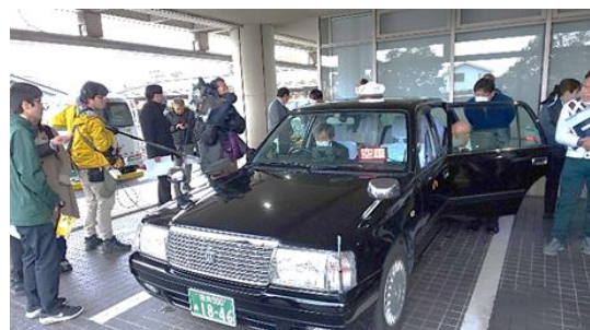
多くの報道機関も取材

刃物を持った強盗犯との具体的な対応の仕方の実習とともに、無線基地への通報訓練と無線基地からの110番通報訓練が実施されましたが、警察の担当者からは、通報に当たっては、犯人の年齢や服装、逃走方面などについて、記憶がはっきりしているものとあいまいなものをしっかり区別してその旨連絡すること、また、110番通報については、捜査等に必要情報は受付オペレータの方から順次聞いて手配してくれるので、慌てず落ち着いて連絡すればよいなどの指導がありました。