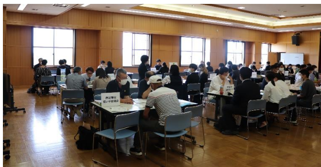
法人就業マッチングフェア(R5.6.10 農業大学校)