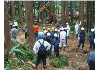
森の仕事体験(上越) (R5.8.9)