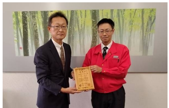
12月13日 感謝状贈呈 株式会社コメリ