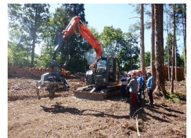
「緑の雇用」集合研修(FW3) (R5.8.23)