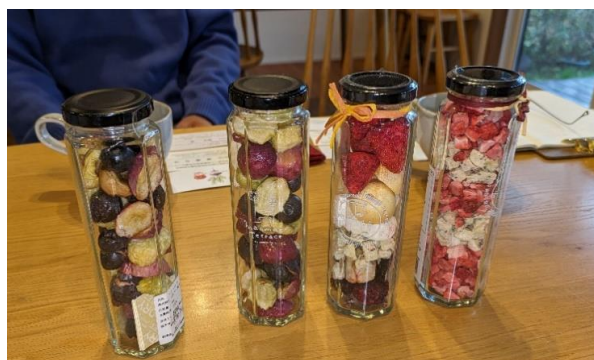
フリーズドライの商品の販路開拓支援