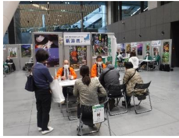
森林の仕事ガイダンス (R5.12.2)