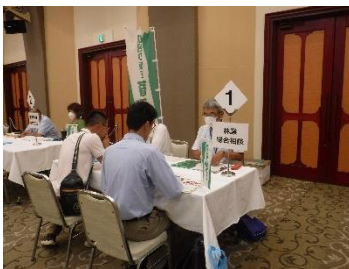
(就農・就業チャレンジフェア (R5.8.27))