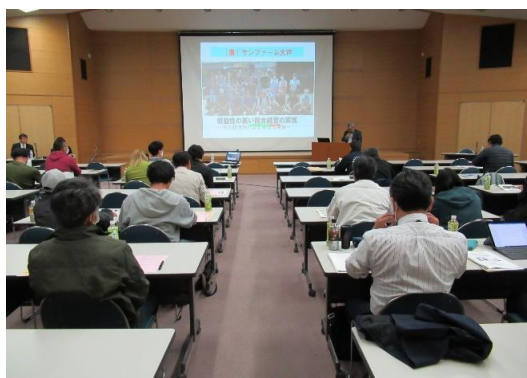
農業法人設立支援・会計税務セミナー (R5.11.9:燕三条地場産業振興センター)