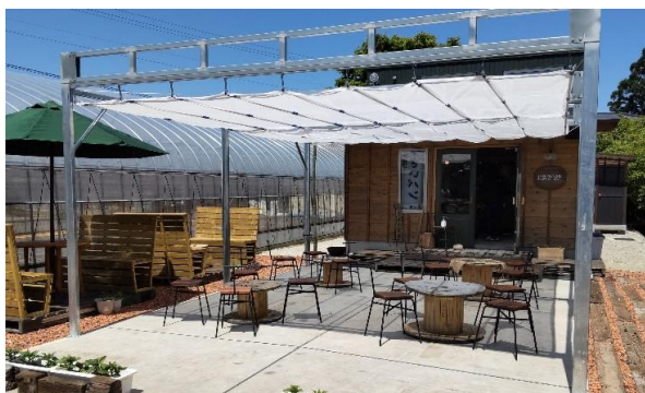
農家パン屋の開業を支援