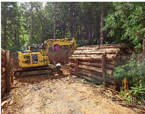
柏崎市（細越団地）利用間伐集積