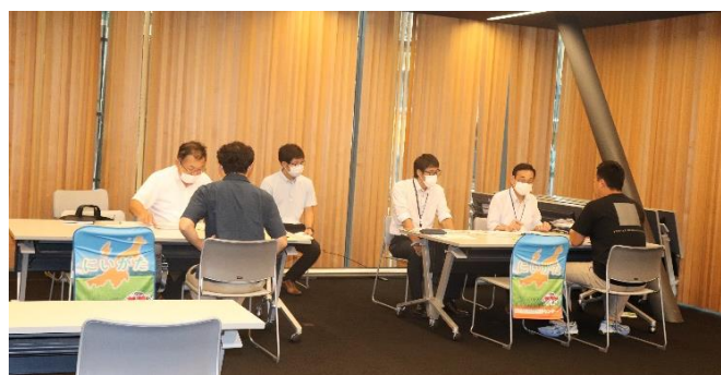
農業「はじめの一步」個別相談会(R5.9.23 アオーレ長岡)