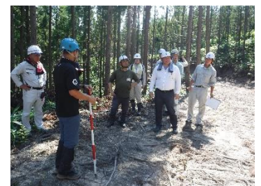
森林施業プランナー研修 (R5.8.29)