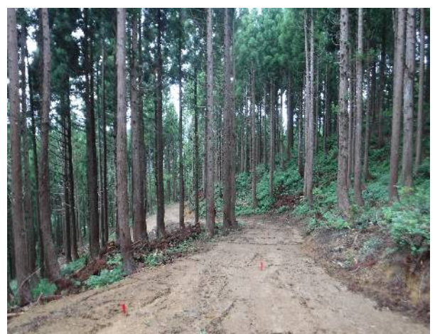
上越市（大島第2団地）森林作業道開設