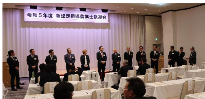
新認定指導農業士歓迎会(R6.1.26 新潟東映ホテル)