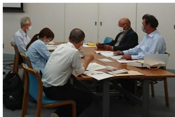
インボイス制度セミナー後の個別相談会 (R5.6.14:新潟テルサ)