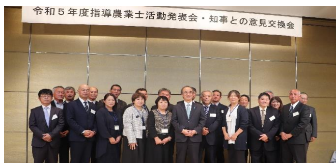
活動発表会・知事との意見交換会(R5.11.16 ホテル日航新潟)